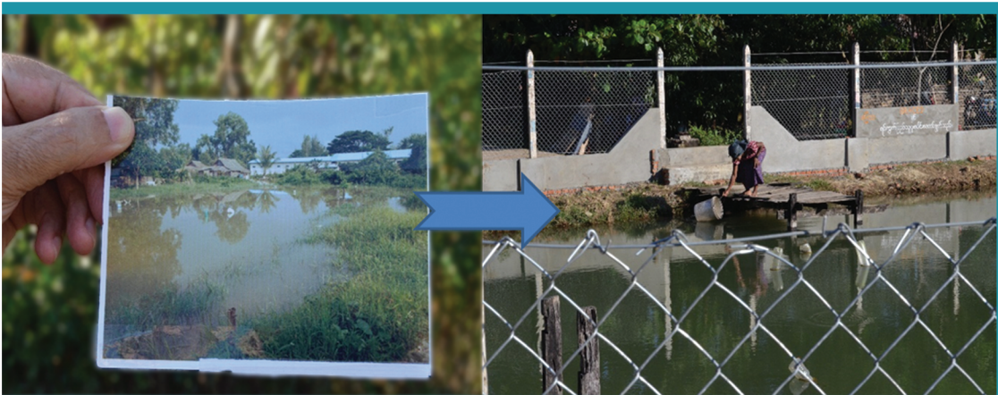
မွန်ပြည်နယ်၊ မော်လမြိုင်မြို့နယ် ဇေယျာသီရိ ရပ်ကွက် ၿာဘေးဒဏ်ခံနိုင်စွမ်းရေကန် တောင်ခတ်ပြင်ခြင်း မပြုလုပ်မီ နှင့် ပြုလုပ်ပြီးနောက် ရိုက်ကူးထားသည့် ပုံ