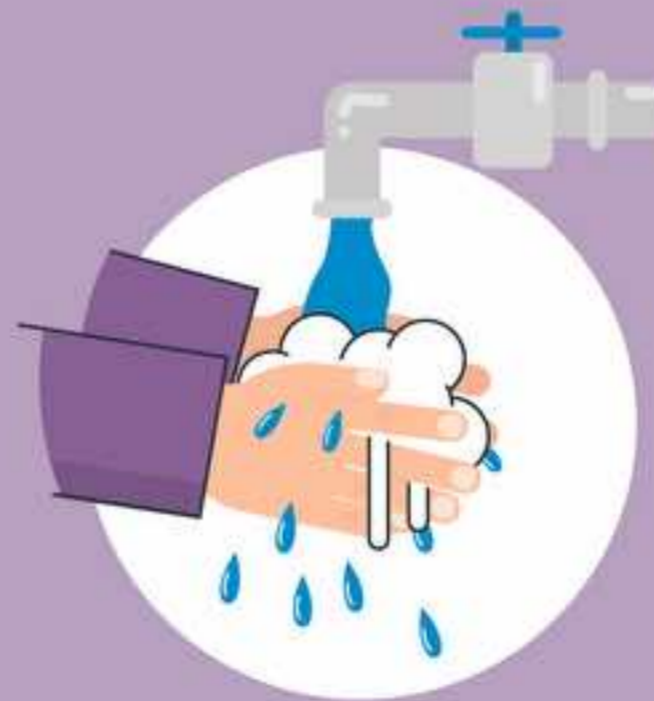
ပါးစပ်နှင့်နှာခေါင်းစည်းကို ဖယ်ရှားပြီးပါက လက်များကို သန့်ရှင်းပါ။