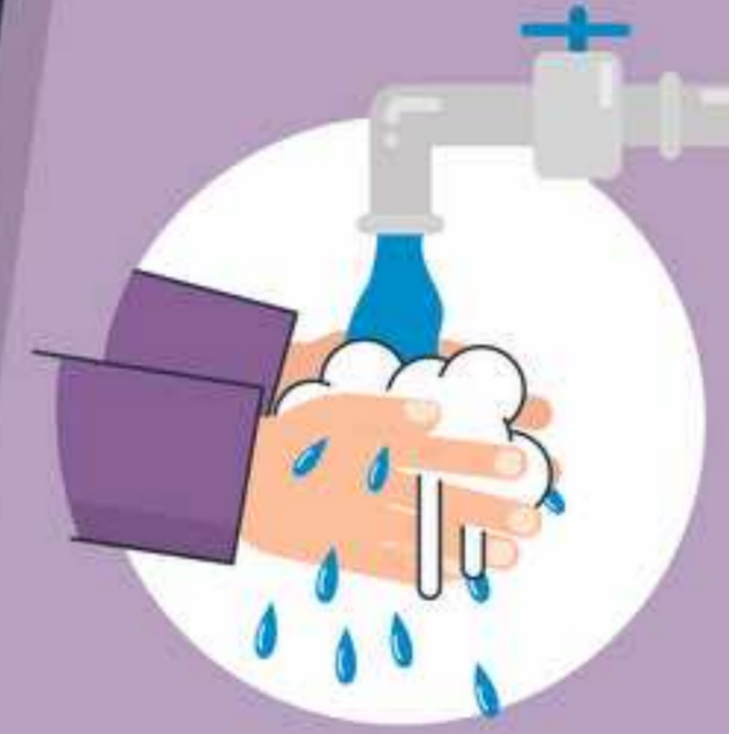
ပါးစပ်နှင့်နှာခေါင်းစည်းကို မကိုင်တွယ်မီ လက်များကို ဆေးကြောသန့်ရှင်းပါ။