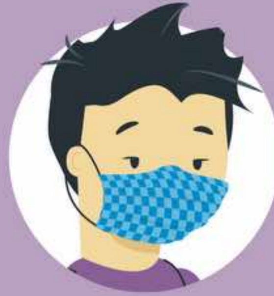
ပါးစပ်၊ နှာခေါင်းနှင့် မေးစေ့ တို့ကို ကာထားနိုင်ပါစေ။