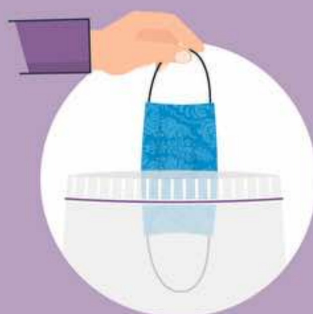
ပါးစပ်နှင့်နှာခေါင်းစည်းကို သန့်ရှင်းပြီး ဖယ်ရှားပါသော ပလပ်စတစ်အိတ် (သို့) အဖုံးပါသော ပူးထဲထည့်၍ သိမ်းဆည်းပါ။