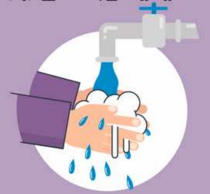
ပါးစပ်နှင့်နှာခေါင်းစည်းကို မဖယ်ရှားခင် လက်များကို သန့်ရှင်းပါ။