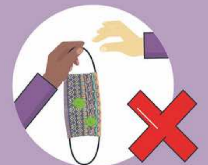
ပါးစပ်နှင့်နှာခေါင်းစည်းကို အခြားသူများနှင့် မျှဝေသုံးစွဲခြင်း မပြုရပါ။