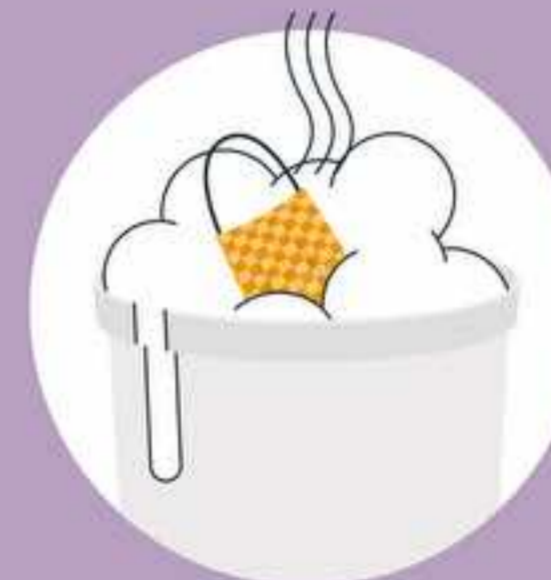
ပါးစပ်နှင့်နှာခေါင်းစည်းကို အနည်းဆုံး တစ်နေ့တစ်ကြိမ် ရေပူ၊ ဆပ်ပြာ တို့ဖြင့် ဆေးကြောသန့်စင်ပါ။