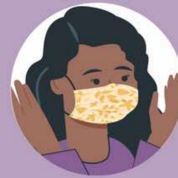
ပါးစပ်နှင့်နှာခေါင်းစည်း၏ အရှေ့ဘက်ကို လက်နှင့် မထိတွေ့ရပါ။