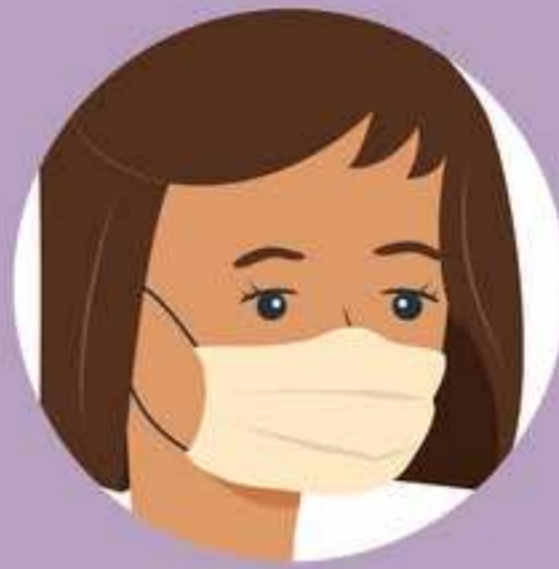
ပါးစပ်နှင့်နှာခေါင်းစည်းကို ကလေးများ၏ မျက်နှာပေါ်တွင် ဘေးနှစ်ဖက်စလုံးမှာ ကွာဟမနေစေရန် ချိန်ညှိပါ။