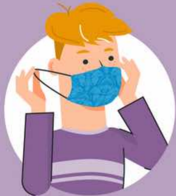
ပါးစပ်နှင့်နှာခေါင်းစည်းကို ကြိုးများမှ ကိုင်၍ဖယ်ရှားပါ။