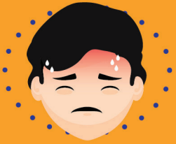
ဖျားခြင်း၊ ကိုယ်ပူခြင်း