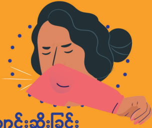
ချောင်းဆိုးခြင်း