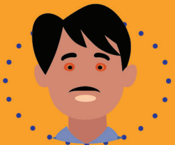
မျက်သားအဖြူမှာ နီလာခြင်း