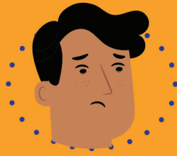
မောပန်းခြင်း