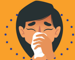
နာခေါင်းပိတ်ခြင်း