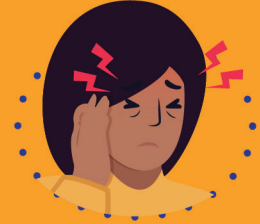
ခေါင်းကိုက်ခြင်း