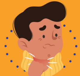
လည်ချောင်းနာခြင်း