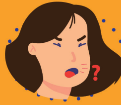
အနံ့အရသာ ပျောက်ဆုံးခြင်း