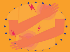
ကြွက်သားနာကျင်ခြင်း