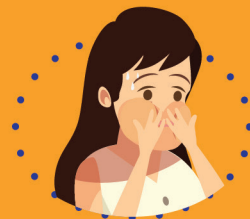
အော့အန်ခြင်း

ကျန်းမာရေးစောင့်ရှောက်မှု အမြန်ဆုံးရယူရန် သင်၏ ဆရာဝန် (သို့) ကျန်းမာရေးဝန်ထမ်းတစ်ဦးအား အမြန်ဆုံးဆက်သွယ်ပါ။