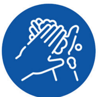
ဂျေတဲသိုဗ်ဂိဗ်ကိဗ်

ဂွဗ်ကိဗ်ပမိဗ်ဂိဗ်ဟိုဗ်ကိဗ်သေလ် ဂျေတဲသိုဗ်ဂိဗ်ကိဗ်သေလ်။