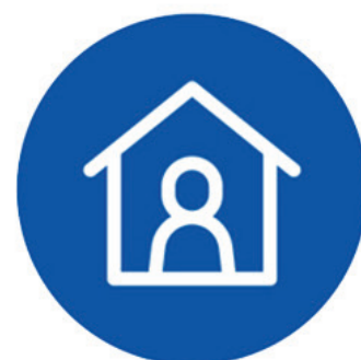
ဟိုဗ်မိဗ်ကိဗ်