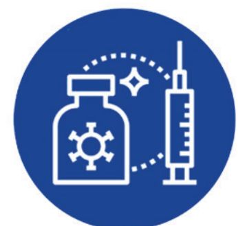
ဟိုဗ်ဒဲသိုဗ် ဂိဗ်ကိဗ်