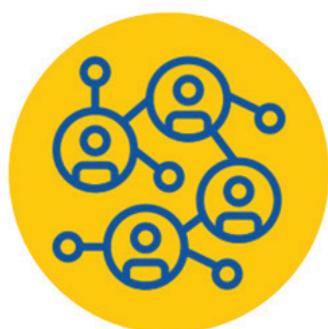
ဟိုဗ်မိဗ်ခါ မိဗ်မိဗ်ဒဲဒဲခိဗ်