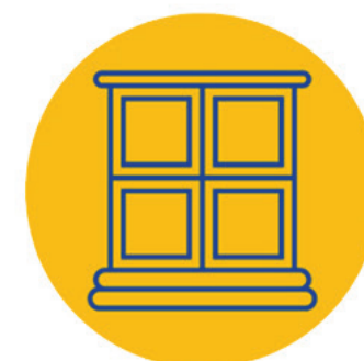
ဟိုဗ်မိဗ်ခါ လိုဗ်ကိဗ်