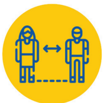
ဂိဗ်လ်ဂိဗ် ဖိဟိုဗ်ကိဗ်