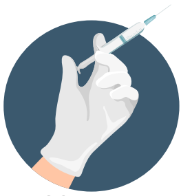
COVID-19 ကာကွယ်ဆေးထိုးနှံခြင်း