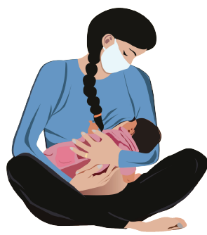
ကိုယ်ဝန်ဆောင်များ နှင့် နို့တိုက်မိခင်များ