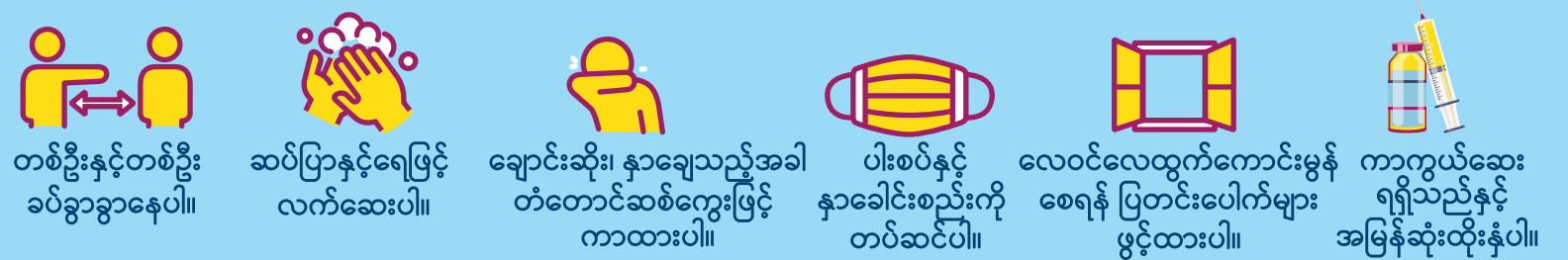
တစ်ဦးနှင့်တစ်ဦး ခပ်ခွာခွာနေပါ။ ဆပ်ပြာနှင့်ရေဖြင့် လက်ဆေးပါ။ ချောင်းဆိုး၊ နှာချေသည့်အခါ တံတောင်ဆစ်ကွေးဖြင့် ကာထားပါ။ ပါးစပ်နှင့် နှာခေါင်းစည်းကို တပ်ဆင်ပါ။ လေဝင်လေထွက်ကောင်းမွန် စေရန် ပြတင်းပေါက်များ ဖွင့်ထားပါ။ ကာကွယ်ဆေး ရရှိသည်နှင့် အမြန်ဆုံးထိုးနှံပါ။

ကြိုတင်ကာကွယ်မှု အချက် ၆ ချက်လုံးကို လိုက်နာပါ။