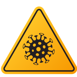
COVID-19 ဆိုင်ရာ ကြိုတင်ကာကွယ်မှုများ