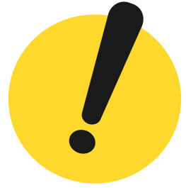
COVID-19 ရောဂါ ပြင်းထန်နိုင်ခြင်းအန္တရာယ်