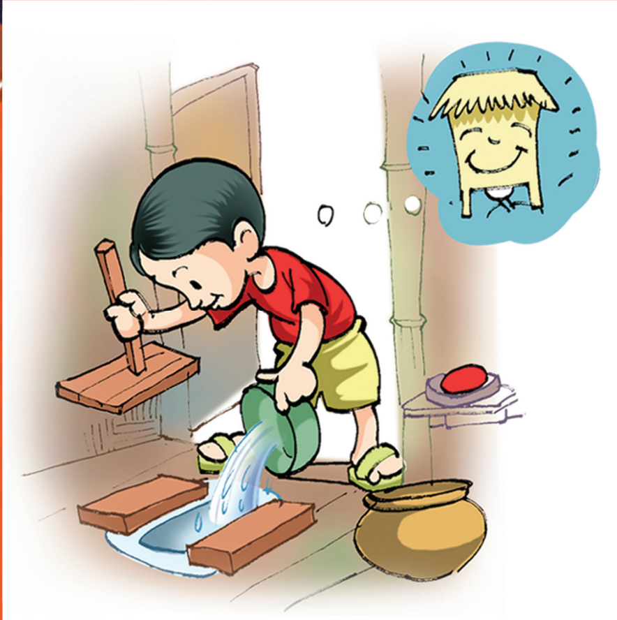
အိမ်သာကိုသုံးပြီးတိုင်း ရေနဲ့ သန့်ရှင်းအောင် ဆေးချပါ