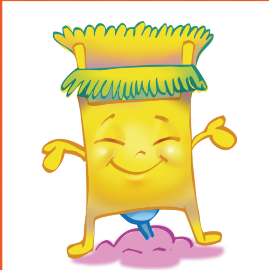
ကျန်းမာသန့်ရှင်းရေးဂါကင်းဖို့ ယင်လုံအိမ်သာသုံးကြစို့