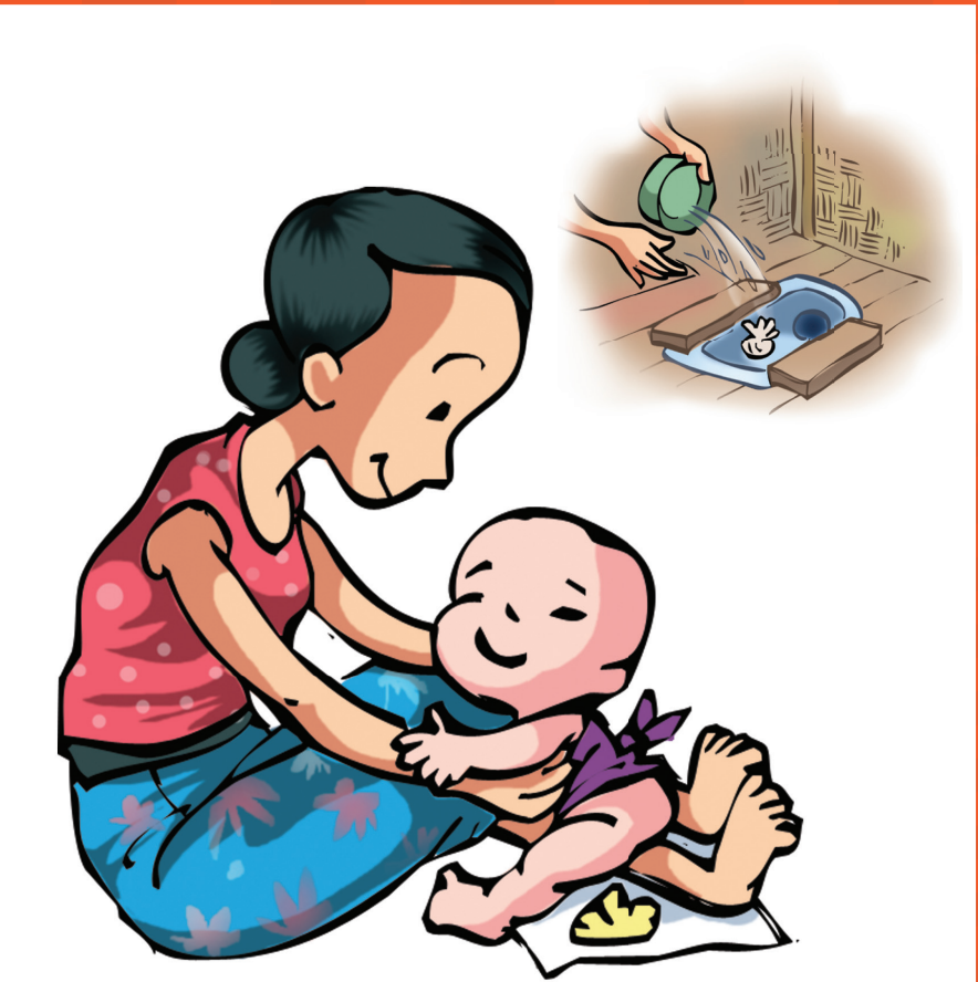
အရွယ်မရောက်သေးတဲ့ ကလေးငယ်ရဲ့ မစင်တွေကို အိမ်သာမှာသာ ခွန်ပစ်ပါ