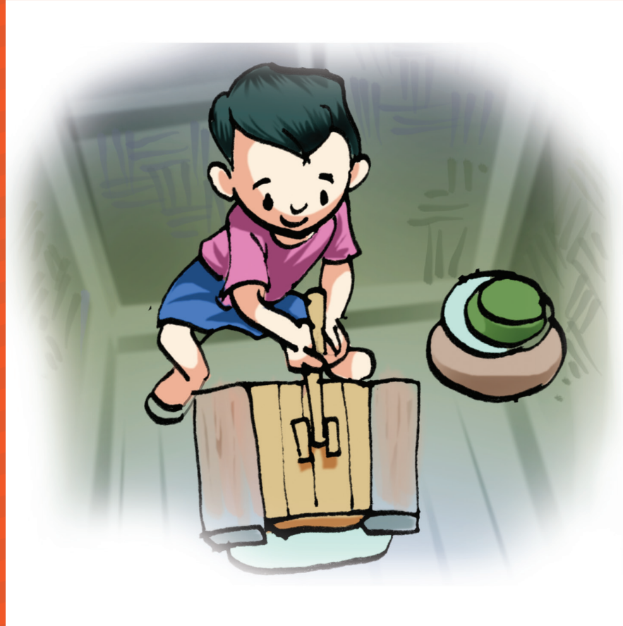
ယင်မနားအောင်နဲ့ ကျင်းထဲကို ယင်မဝင်အောင် အိမ်သာခွက်ကို အဖုံးဖုံးထားပါ