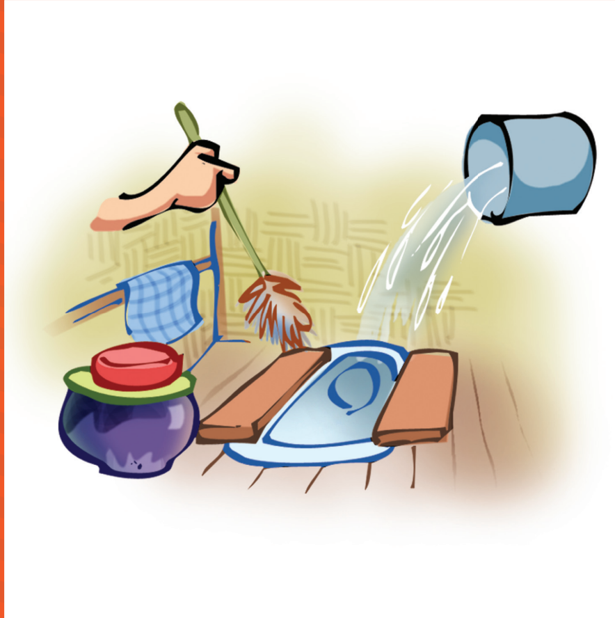
အိမ်သာကို သန့်ရှင်းရေး ပုံမှန်ပြုလုပ်ပါ