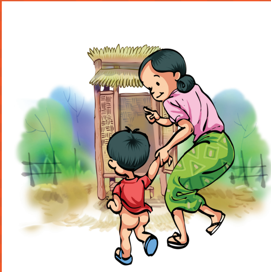
ကလေးငယ်တွေ အိမ်သာကို အသုံးပြုတက်အောင် သင်ကြားပြသပေးပါ