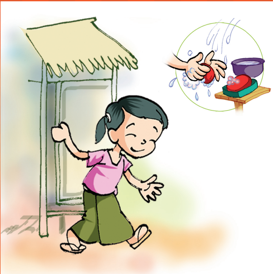
အိမ်သာတက်ပြီးတဲ့အခါတိုင်း လက်ကိုဆပ်ပြာနဲ့ စင်ကြယ်အောင် ဆေးကြောပါ