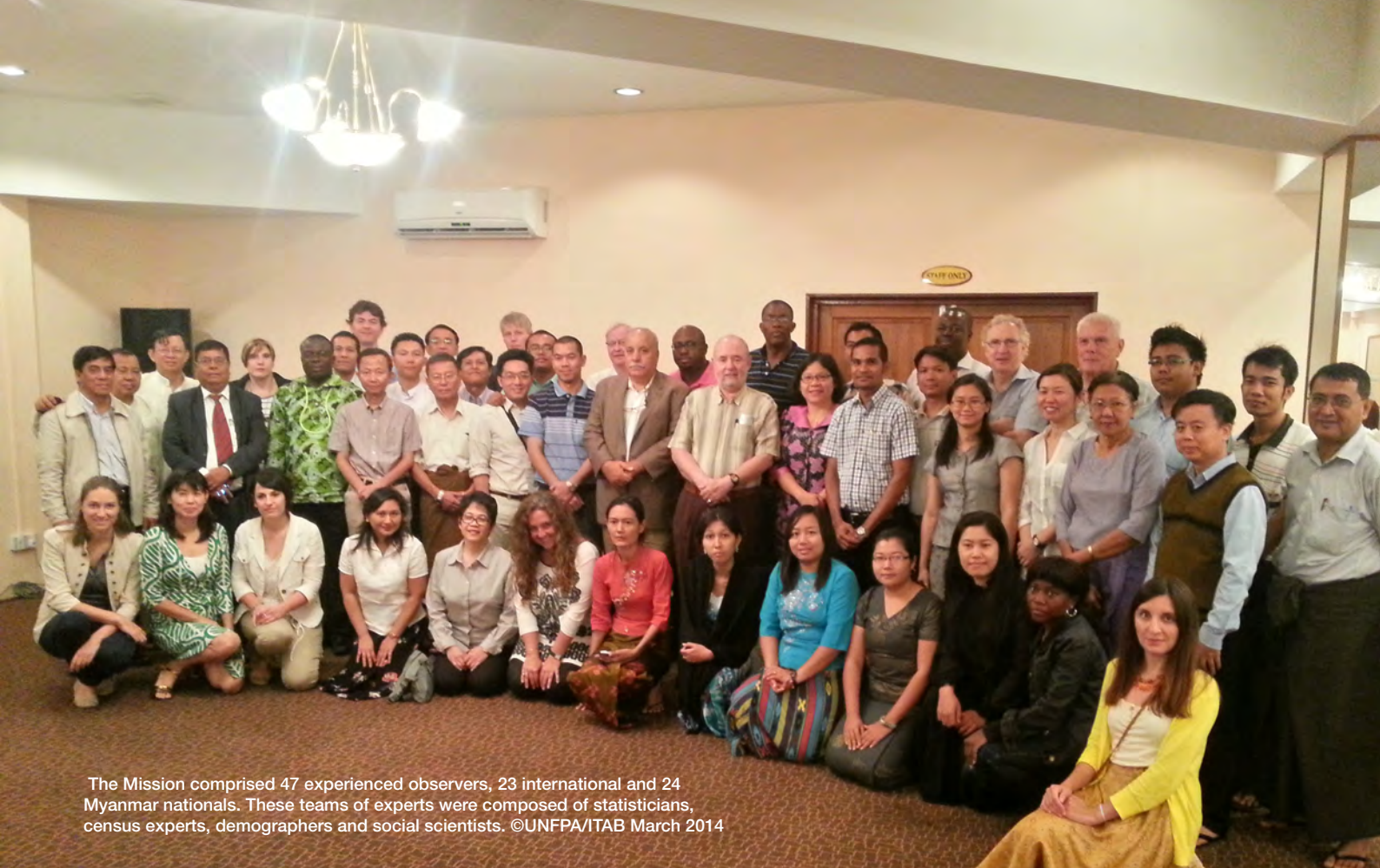
The Mission comprised 47 experienced observers, 23 international and 24 Myanmar nationals. These teams of experts were composed of statisticians, census experts, demographers and social scientists. ©UNFPA/ITAB March 2014