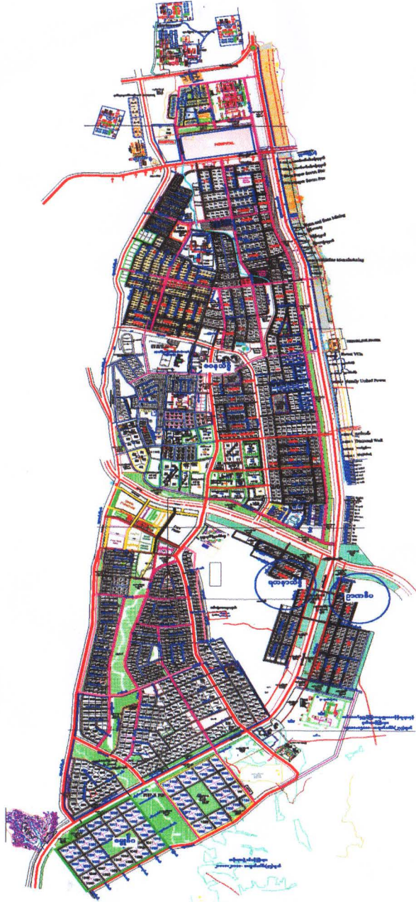
ဥတ္တရသီရိရပ်ကွက်