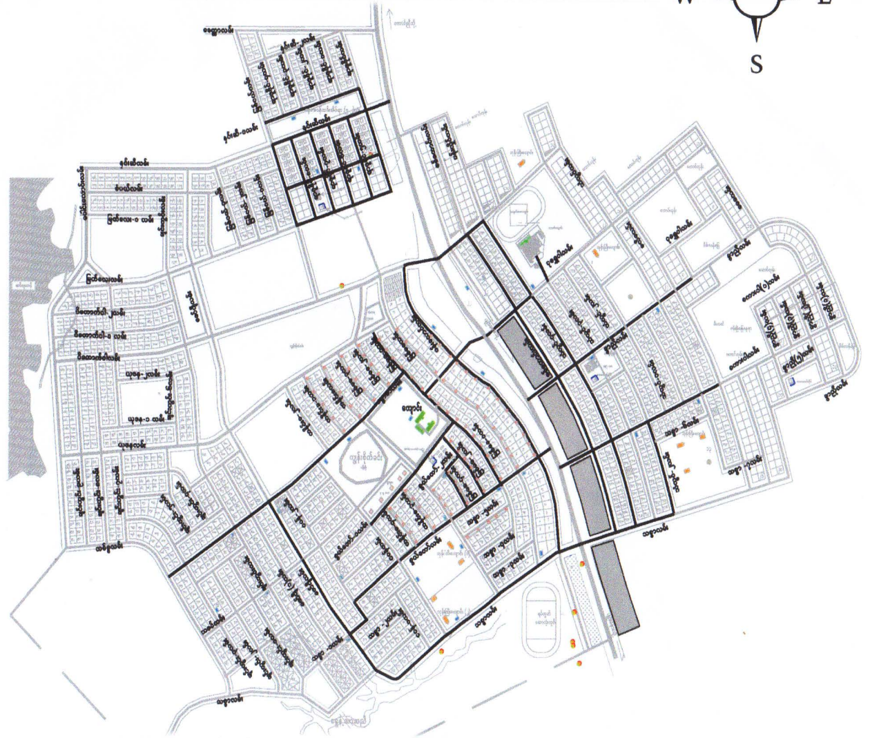
ရွှေနံ့သာရပ်ကွက်