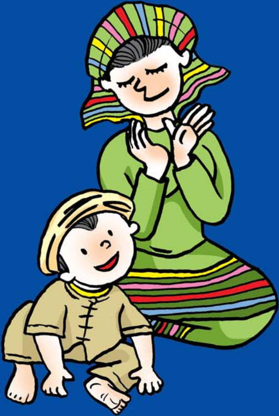
ကလေးများ ဖွံ့ဖြိုးမှု ပုံမှန် ဖြစ်၊ မဖြစ်ကို စောစီးစွာ သိရှိနိုင်မှသာ ကြိုတင်ကာကွယ်ခြင်း၊ မှန်ကန်စွာ ပြုစုပျိုးထောင်ခြင်းများ ပြုလုပ်နိုင်ပါသည်။